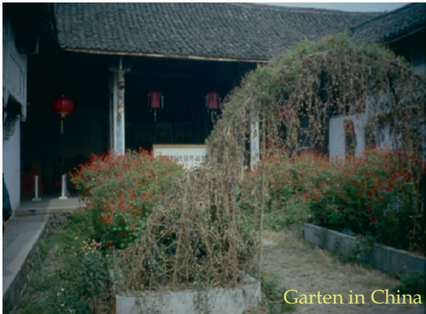
Garten in China

Wenn das eigene Haus von einem üppig wuchernden Garten umgeben ist, so wird ihnen das Glück gewogen sein. Ist die Umwelt