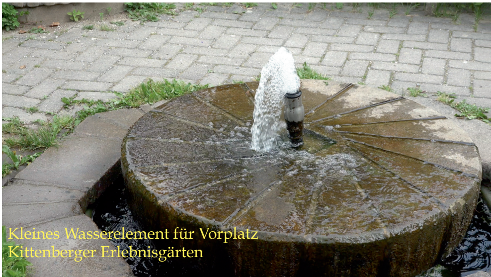
Kleines Wasserelement für Vorplatz Kittenberger Erlebnisgärten

Befindet sich der Vorplatz im Norden, so sollte ein kleines Wasserelement angelegt werden. Öffnet sich der Vorplatz nach Süden, sollte er immer gut ausgeleuchtet sein. Liegt der Vorplatz nach Osten oder Südosten, so sollten immer Blumen gepflanzt sein. Ist der Vorplatz nach Westen oder Nordwesten ausgerichtet, so kann ein Wind- oder Klangspiel für günstige Energien sorgen. Bei einem nach Südwesten oder Nordosten gelegenen Vorplatz soll man mit Kieselsteinen einen geschwungenen Weg anlegen.